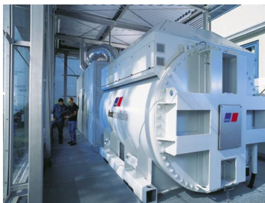
Die erste Bi-Fuel-Brennstoffzelle. Sie wird mit Erdgas, mit Methanol oder beidem betrieben.

Mit der Einführung von SAP-Motorenbau auf einer Windowsplattform im Januar 2004 wurde der Hostbetrieb eingestellt. Für die Ablösung von RZ-Anlas ist eine umfassende Ausschreibung durchgeführt worden. Das Pflichtenheft sah Funktionalitäten wie eine grafische Benutzeroberfläche, das Erstellen individueller Workflows und Abbilden dezentraler Prozesse sowie insbesondere die Integrationsfähigkeit des Systems vor. MTU entschied sich im Sommer 2002 aufgrund der fachlichen Anforderungen, der räumlichen Nähe und der überzeugenden Produktphilosophie für das IT-Asset Management Produkt Valuemation der USU.